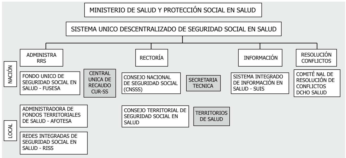
Gráfica No. 3 Sistema único descentralizado de seguridad social en salud. PL No. 105/12 S

Adicionalmente, con el proyecto se propone establecer un Sistema Único Descentralizado de Seguridad Social en Salud con el fin de asegurar cobertura, buena administración de recursos y sostenibilidad del sistema de seguridad social en salud: se sustituye al FOSYGA, se eliminan las EPS y crean diferentes organismos de dirección, administración de recursos e información y resolución de conflictos, en un esquema de administración regulada.