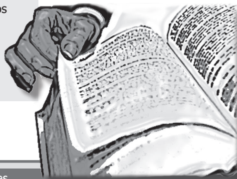
● Cuadro 1. Principios orientadores

Desarrollar el artículo 185 1 de la Constitución Política, con el fin de adoptar un régimen ético-disciplinario aplicable a los miembros del Congreso de la República por el comportamiento indecoroso, irregular o inmoral en el ejercicio de sus funciones.