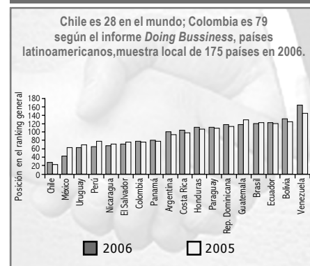
Cuadro 2. Escalafón de facilidad para hacer negocios